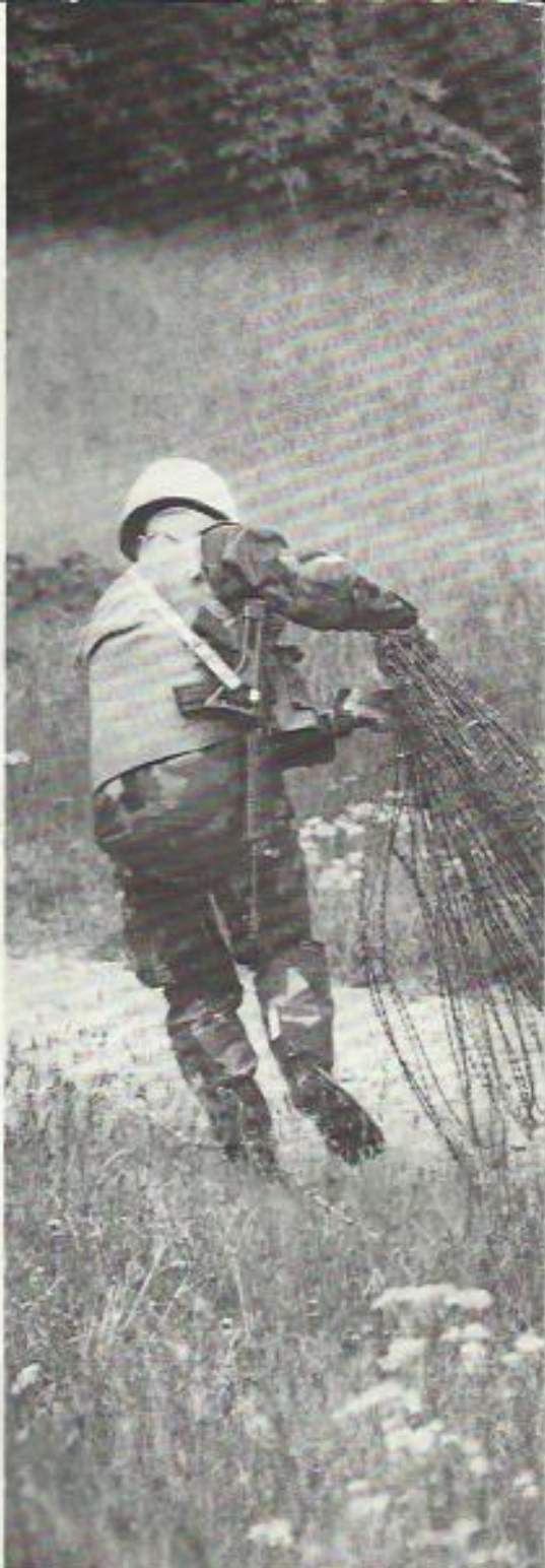
Mobile checkpoint igen. Det är bråttom at

Alla nivåer omfattas alltså. Det är därför viktigt, att den attityd som omtalats ovan, tränger in på alla nivåer. Firm but friendly , alltså. I första hand gäller det ju att kyla ned genom att samtala.