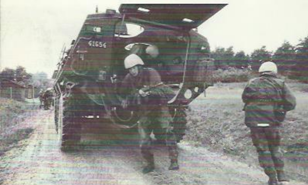
En fordonspatrull rycker ut.

Vid möten – spontana eller arrangerade – ska uppträdandet präglas av lugn, fasthet och vänlighet. Med ett utmanande kroppsspråk och gälla stämmor når man sannolikt inte långt.