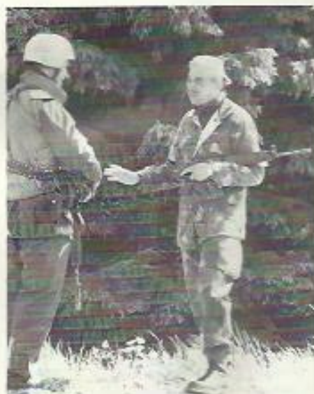
Förhandlingar kan uppstå också på "marknivå".

Andra saker som bör inpräntas i detta sammanhang, är avstånden mellan fordonen inom konvojen – håll ögonkontakt – och att inga främmande fordon släpps in mellan fordonen i konvojen. Ingen situation är