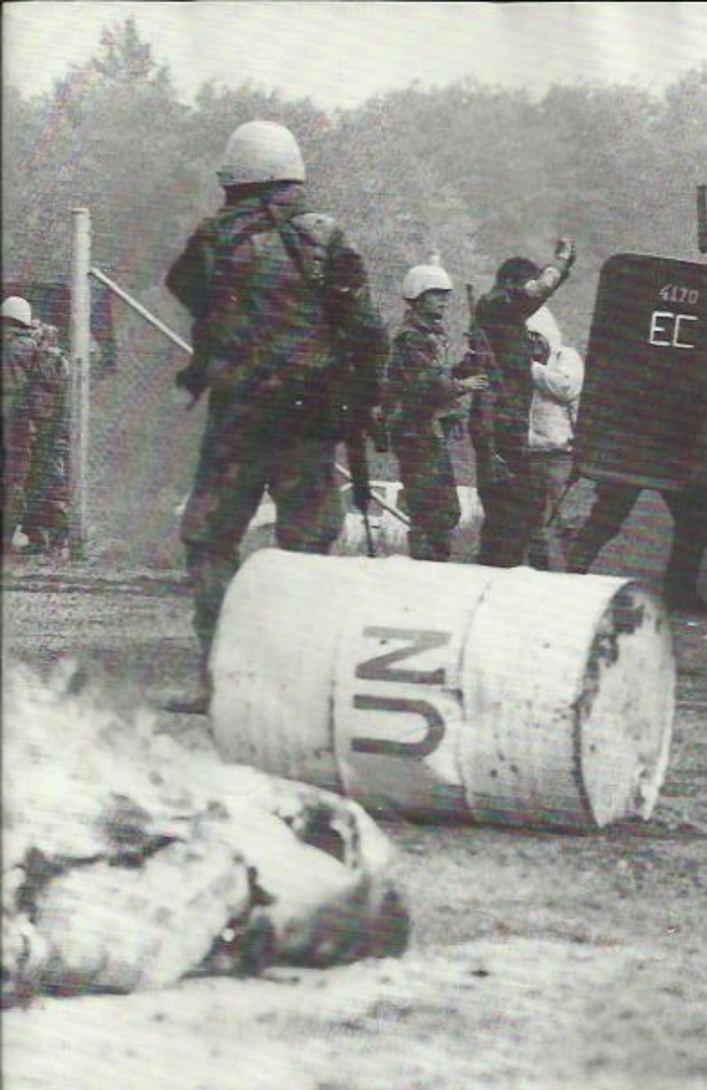
Det är svårt att behålla sinnesnärvaron.

kunna se ända till intilliggande OP. Observationsområdena ska helst inte gränsa till utan överlappa varandra. Det underlättar en effektiv bevakning.