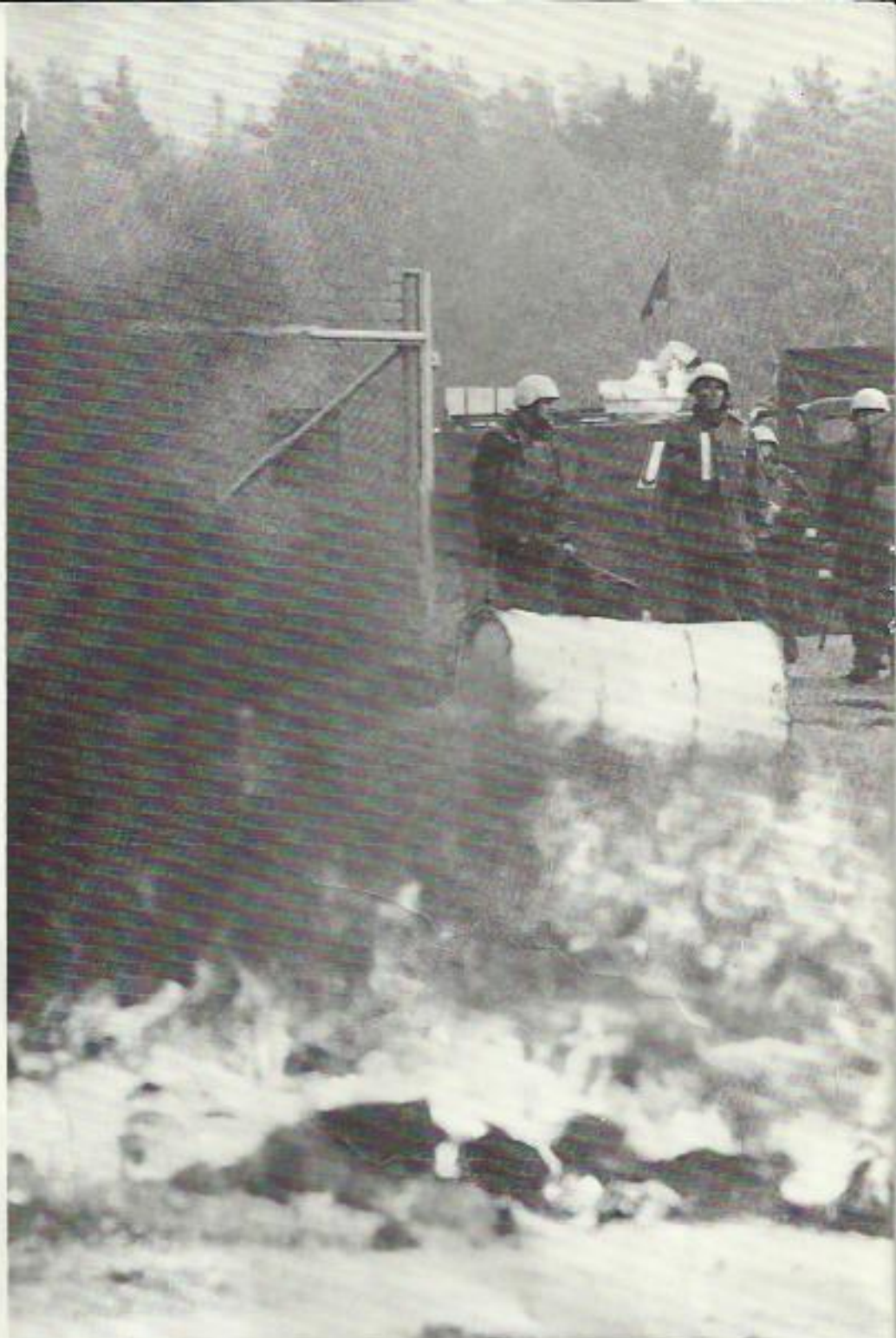
En bilbomb har exploderat vid en fast checkpoint. Också vid övning kan det va

För arbetet i "missionen" gäller alltså strävan att vara såväl Firm som